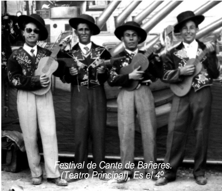
Festival de Cante de Bañeres. (Teatro Principal), Es el 4º.